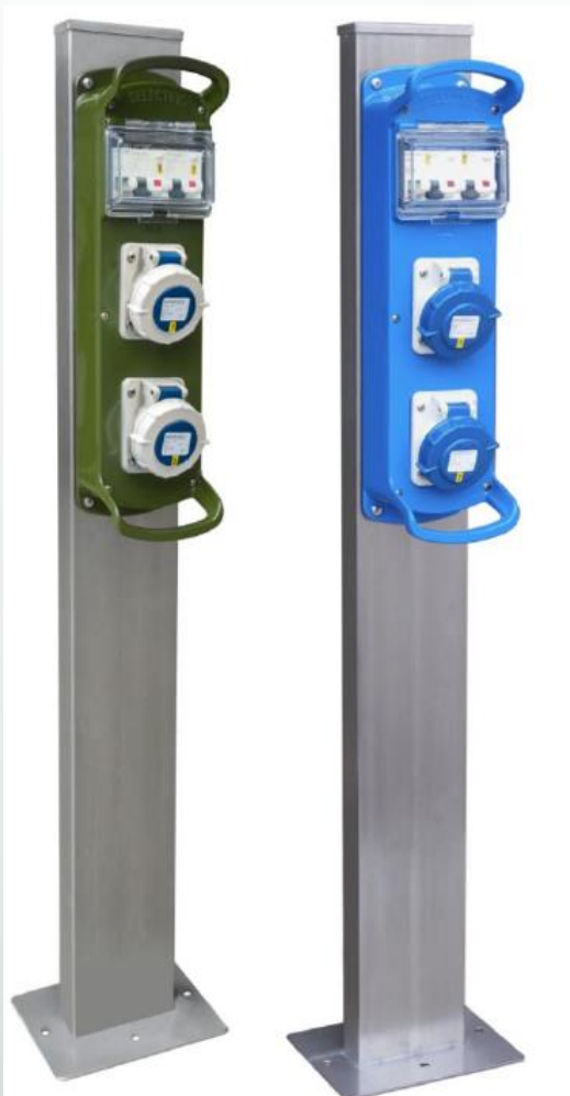
verde Ral 6031-F9 o Azzurro Ral 5015

Cassetta in polycarbonato super tenace resistente agli urti, al calore e ai raggi UV