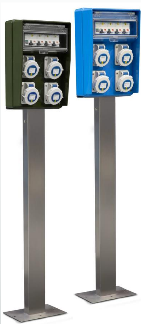
verde Ral 6031-F9 o Azzurro Ral 5015

Cassetta in policarbonato super tenace resistente agli urti, al calore e ai raggi UV